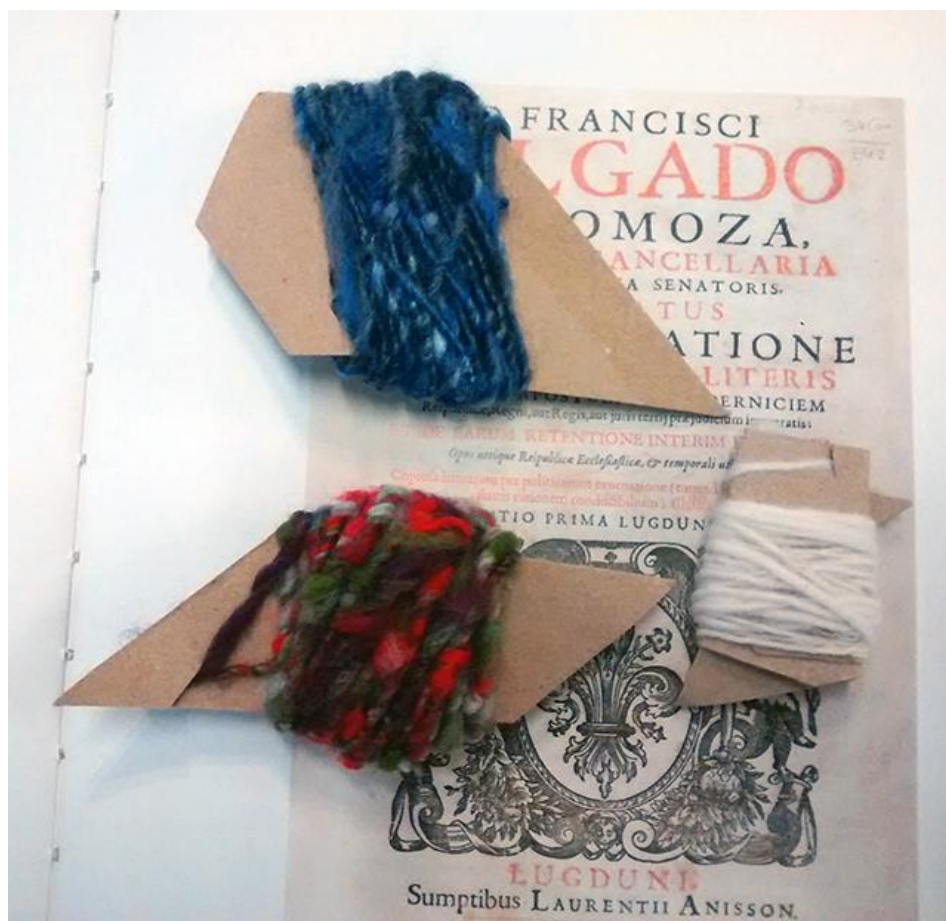
Hilado con borra de lana reciclada.