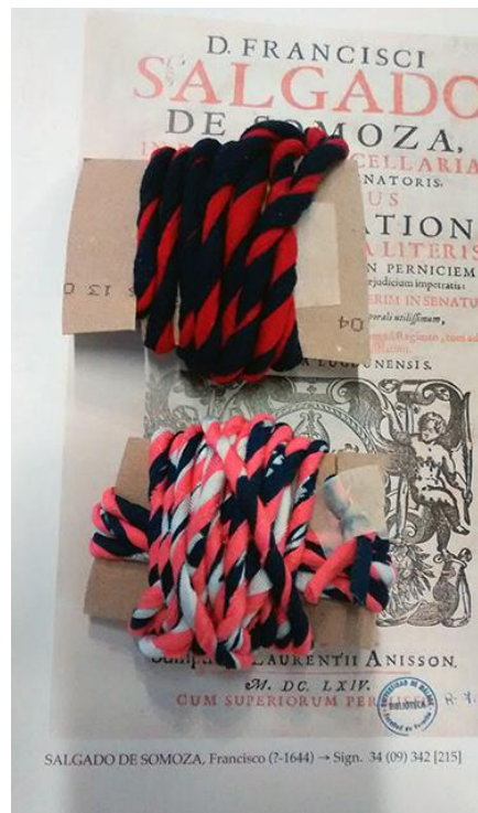
Hilado con tela reciclada previamente recortada en tiras.